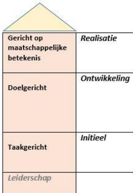
Figuur 2 Sturing

en moeten vorm geven aan de uitkomsten. Indien gewenst en mogelijk is dan een vorm van ‘collectieve autonomie’ aan de orde. Er blijft in elke fase behoefte aan leiderschap, maar wel in een telkens andere rol, van sturend op taken naar ruimte scheppend en verbindend om tot maatschappelijke waarde te komen.